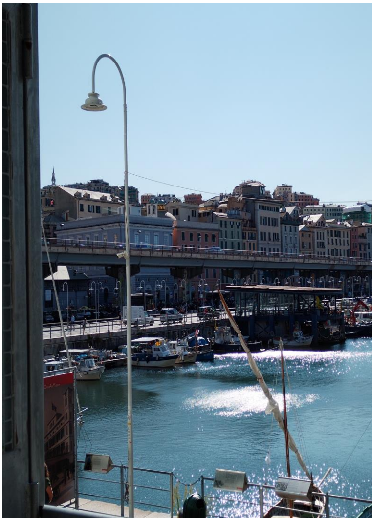
Vista dal DIEC

Il Corso di laurea magistrale in Economia e Management Marittimo e Portuale (EMMP) è unico in Italia per le peculiarità della sua offerta formativa caratterizzata da un'elevata interdisciplinarietà di contenuti specialistici nelle discipline aziendali, economiche, quantitative e giuridiche relative al settore dello shipping e della logistica. Unisce la storica vocazione economica di Genova e della Liguria nel settore dello shipping con un'apertura a esperienze e relazioni nazionali e internazionali.