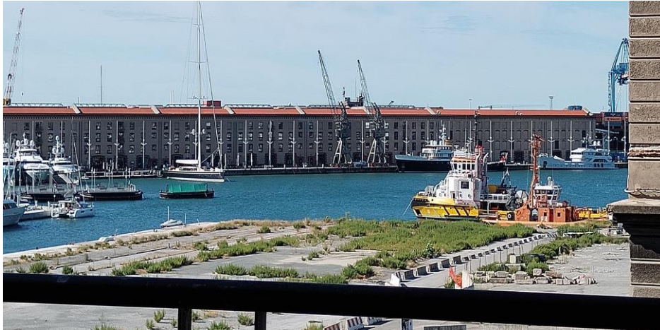
Vista dal DIEC

Nel primo anno si studiano le basi gestionali, economiche, quantitative e giuridiche del trasporto marittimo di merci e di persone, dell'intermodalità, della logistica e dei servizi portuali.