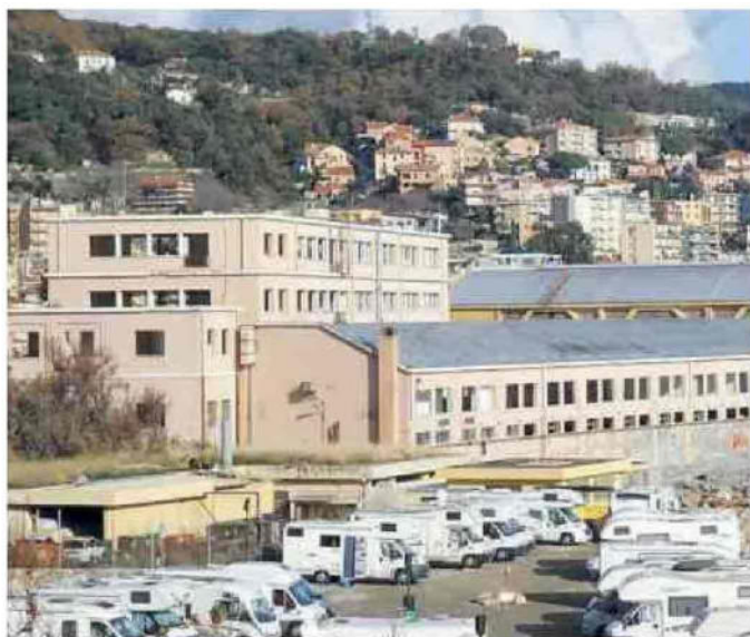
Le aree della ex Piaggio a Finale Ligure