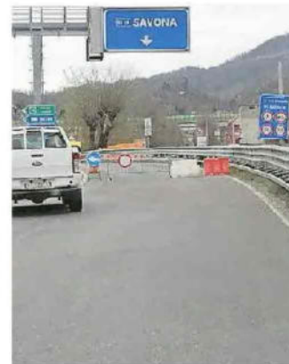
Il tratto chiuso durante i lavori

presentazione del libro "Spazio aereo Piaggio. Un secolo di cultura industriale nella città del volo" di Fabio Caffarena, in stampa presso Il Mulino, nell'ambito delle attività di valorizzazione culturale dell'archivio storico del comune di Finale Ligure, previste dal progetto "Laboratorio Ricci-Sinergie per la memoria". «Questa iniziativa didattica assume particolare importanza per le prospettive che ha fornito, soprattutto in un momento di grande incertezza, come quello attuale, cercando di costruire tramite la condivisione uno strumento per rendere meno incerto il futuro», sottolineano i responsabili del Mudif. —