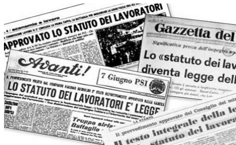
Le testate dei giornali esultano, all'indomani dall'approvazione della legge 20 maggio 1970, numero 300 (41 articoli, divisi in 6 titoli)

Alla seconda facevano invece riferimento i grandi gruppi ar-